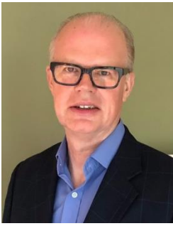
Christopher Pilgrim Llywodraethwr Annibynnol